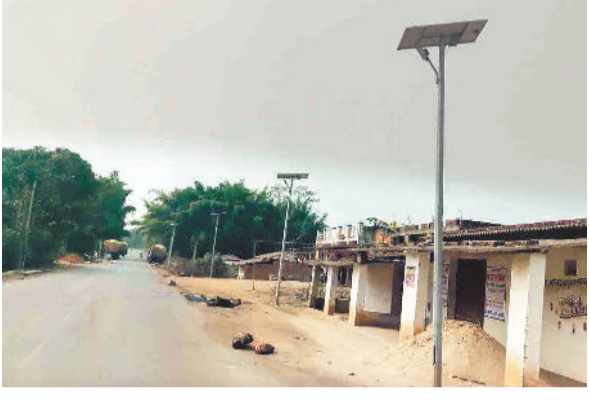
सड़क किनारे खराब सोलर लाइट।